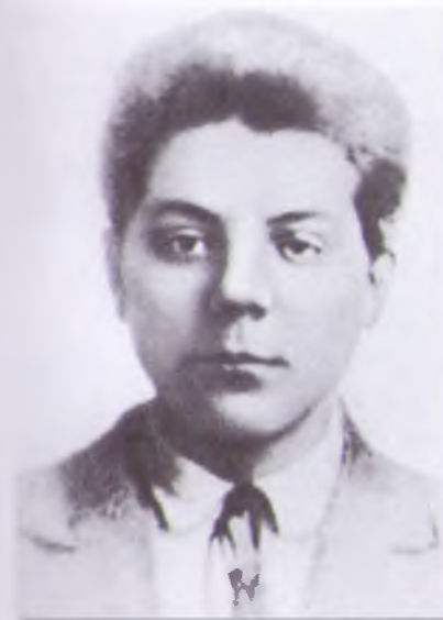
Молодой К.Е. Ворошилов