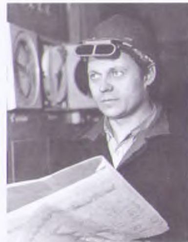
Лауреат Государственной премии СССР, депутат Верховного Совета СССР А.М. Сбитнев