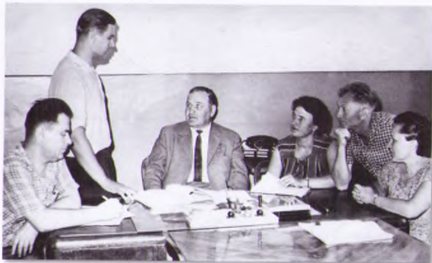
Герой Социалистического Труда П.А. Гмыря с группой народных контролеров. 1966 г.