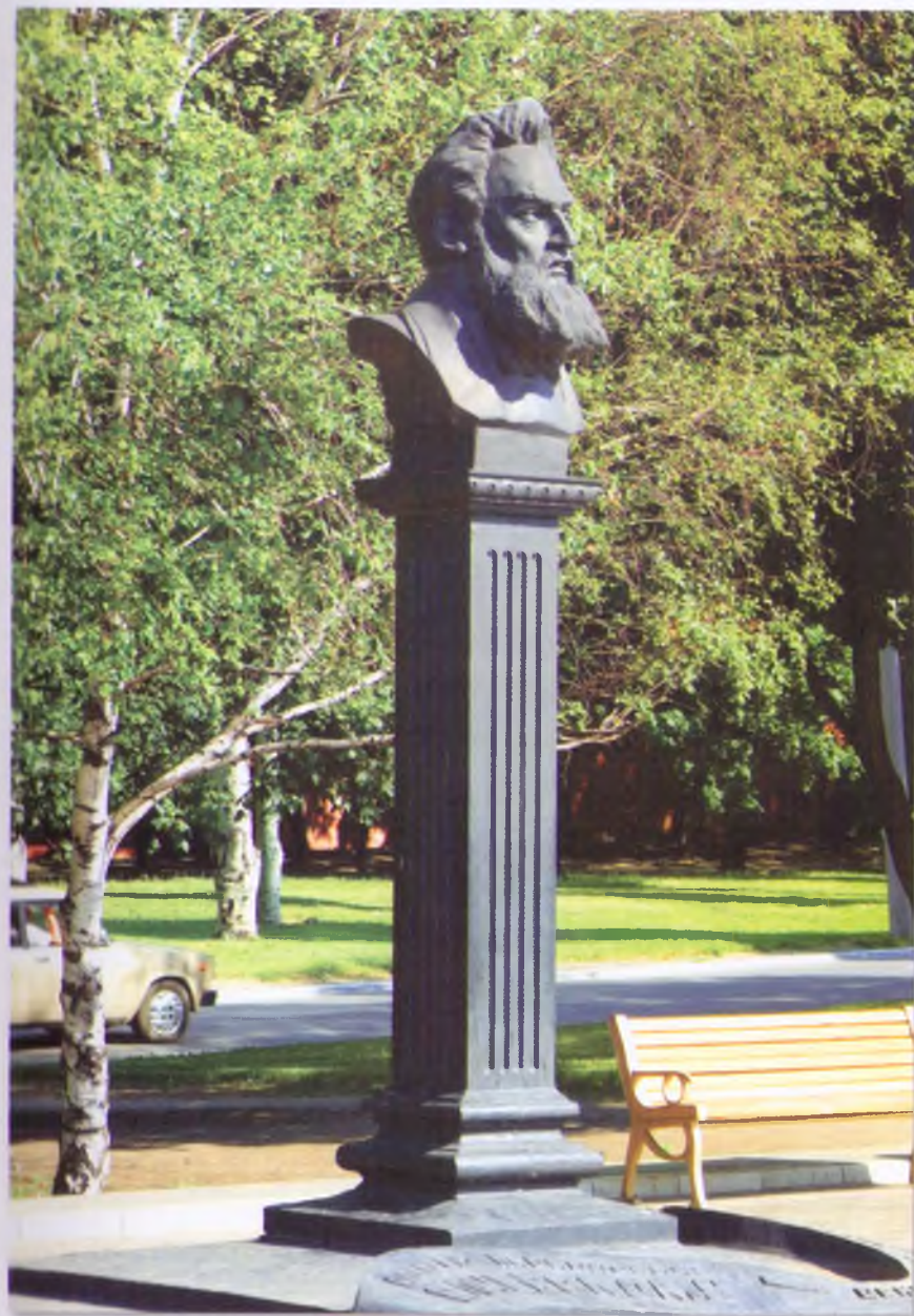
Памятник А.К. Алчевскому. 1996 г.