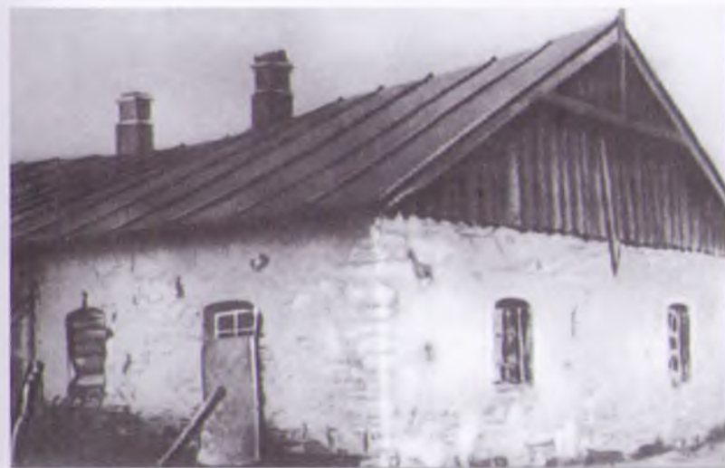
Дом в селе Васильевка, где прошли детские годы К.Е. Ворошилова