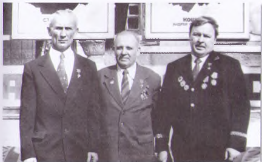
Выпускники ПТУ № 40 Герои Социалистического Труда П.П. Стороженко, А.Ф. Кошура и И.Е. Радецкий возле здания училища