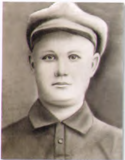
Будущий Герой Советского Союза В.И. Киселев в юности