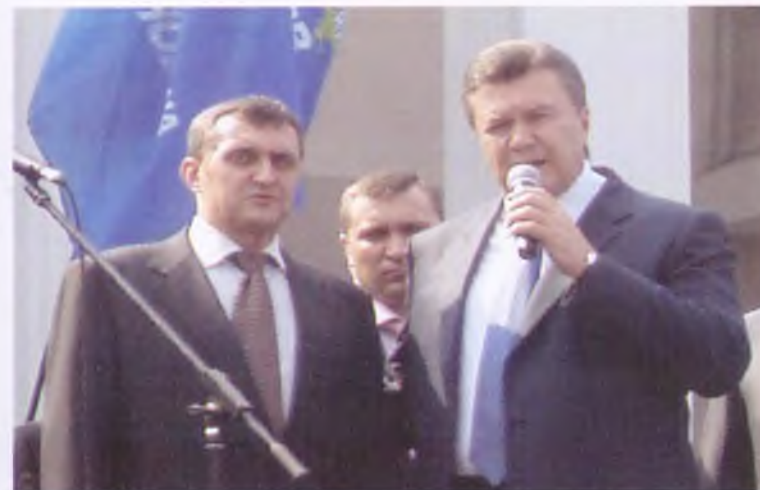
Городской голова Алчевска В.Е. Чуб и Президент Украины В.Ф. Янукович