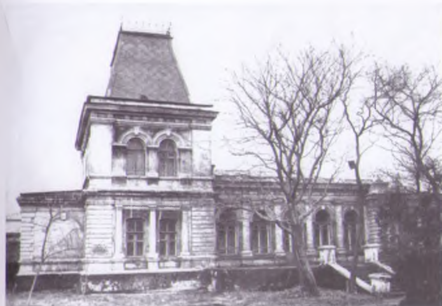
Дом директора завода ДЮМО