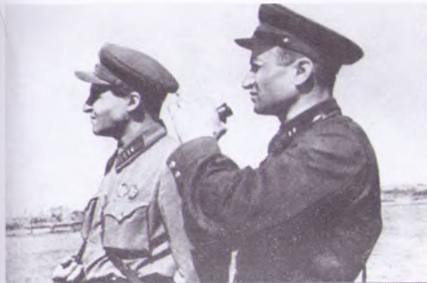
Константин Симонов и Давид Ортенберг переправляются на пароме к Сталинграду. Сентябрь 1942 г.