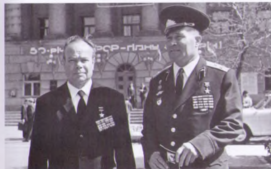
Герои Советского Союза В.С. Снесарев и Н.А. Бабанин у здания ДонГТУ. 1972 г.