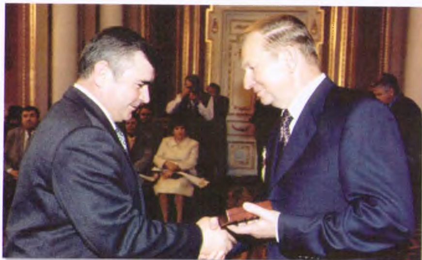
Президент Украины Л.Д. Кучма вручает профессору А.И. Акмаеву Удостоверение и знак Зслуженного работника образования Украины. Киев. 2001 г.