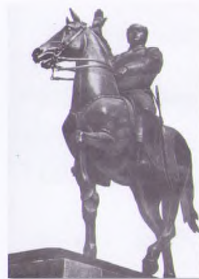
Памятник К.Е. Ворошилову в Луганске. 1981 г.