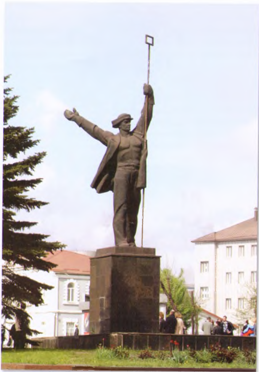
Памятник «Слава труду металлургов»