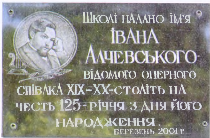
Мемориальная доска в честь Ивана Алчевского на здании Алчевской детской музыкальной школы № 1