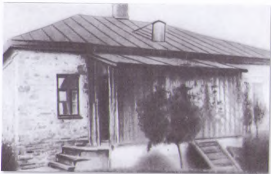
Здание земской школы в Васильевке, в которой учился К.Е. Ворошилов