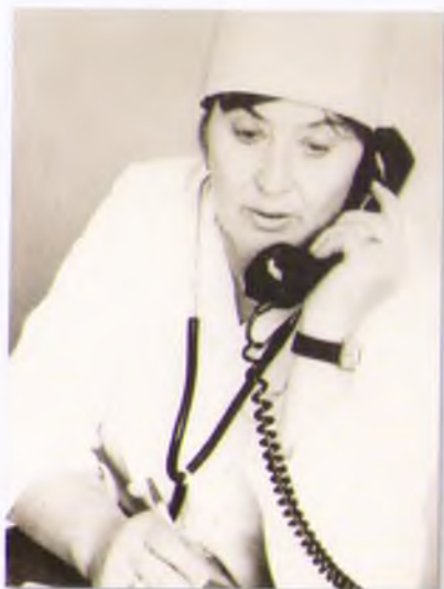
Лауреат Государственной премии СССР врач В.И. Сукач