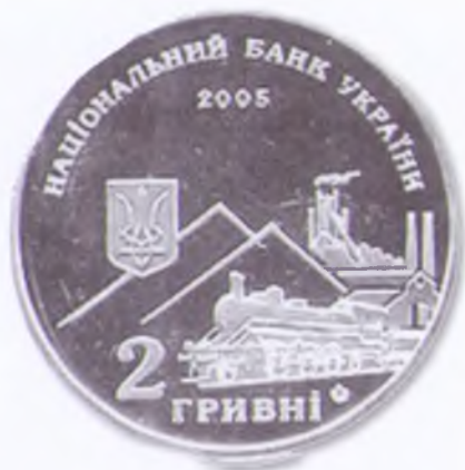
Памятная монета в честь А.К. Алчевского. 2005 г.