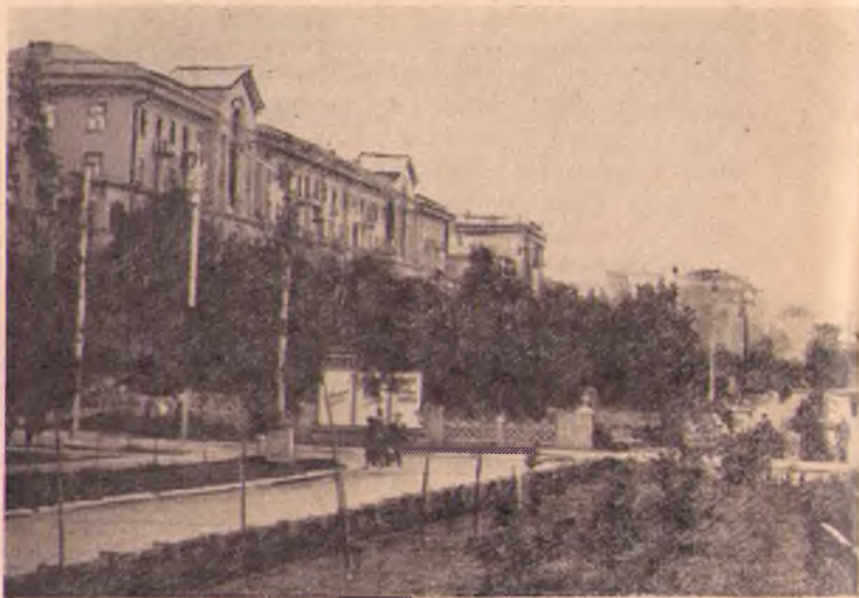
Центральная магистраль города — проспект В. И. Ленина.