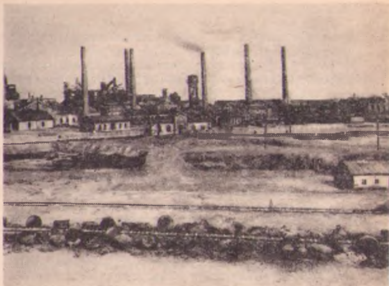
Общий вид завода дореволюционного периода.

онного движения. Капитализм, писалось в газете, уже не движет вперед, а тормозит науку, технику, культуру. Испытывая страх перед крепнущим рабочим классом, он готов поддерживать все, что против этого класса, все реакционное и погубить все новое и молодое. «Но молодое растет и возьмет верх, несмотря ни на что», — утверждал Ленин.