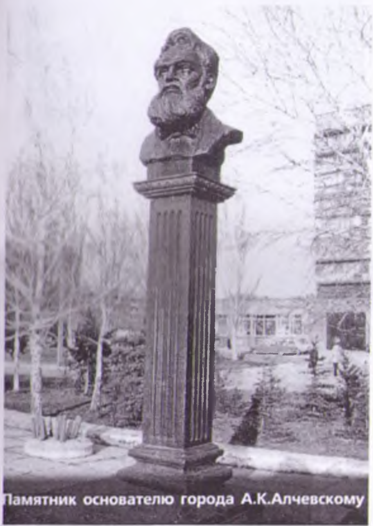
Памятник основателю города А.К.Алчевскому