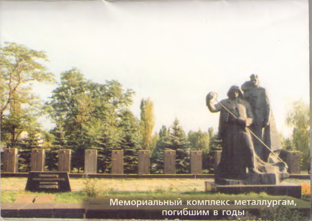
Мемориальный комплекс металлургам, погибшим в годы