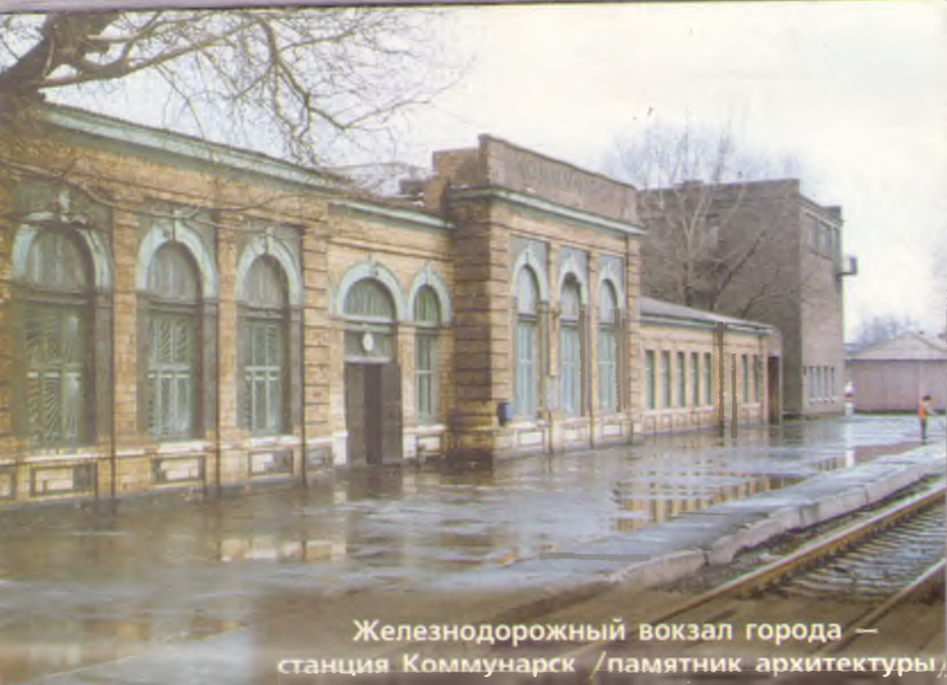
Железнодорожный вокзал города — станция Коммунарск /памятник архитектуры/