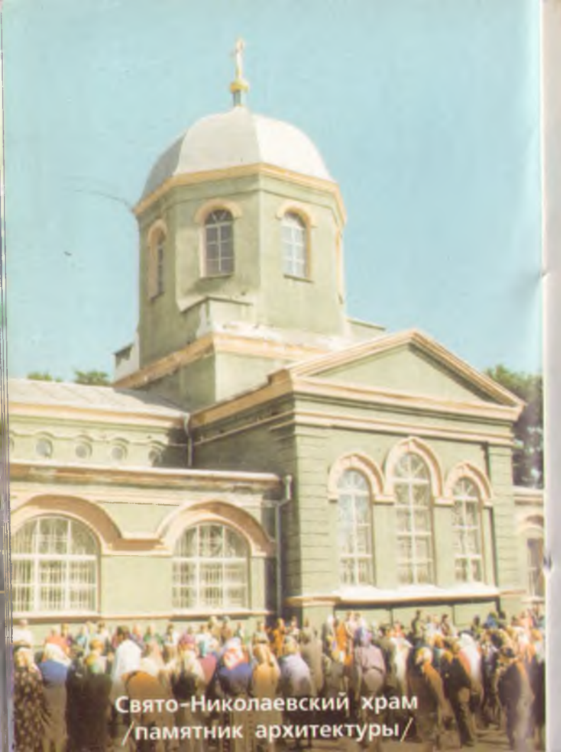
Свято-Николаевский храм /памятник архитектуры/