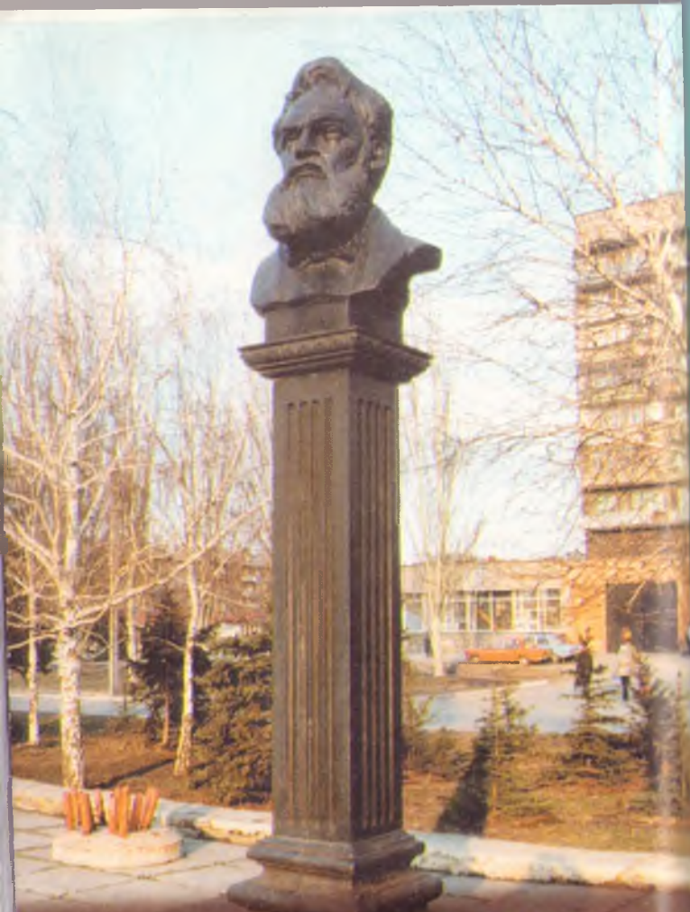
Памятник основателю города А.К.Алчевскому