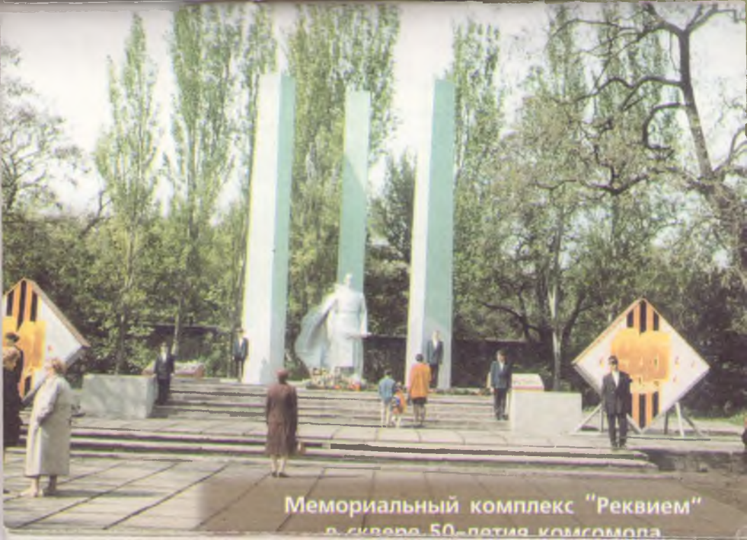
Мемориальный комплекс "Реквием" в связи 50-летия комсомола