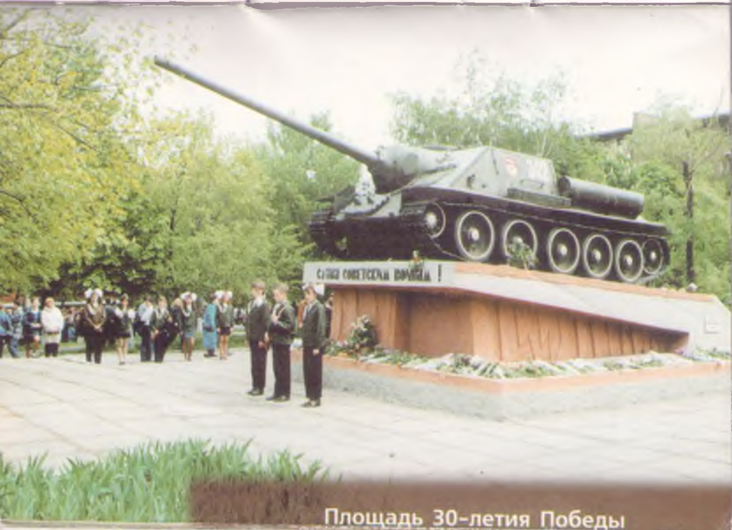
Площадь 30-летия Победы