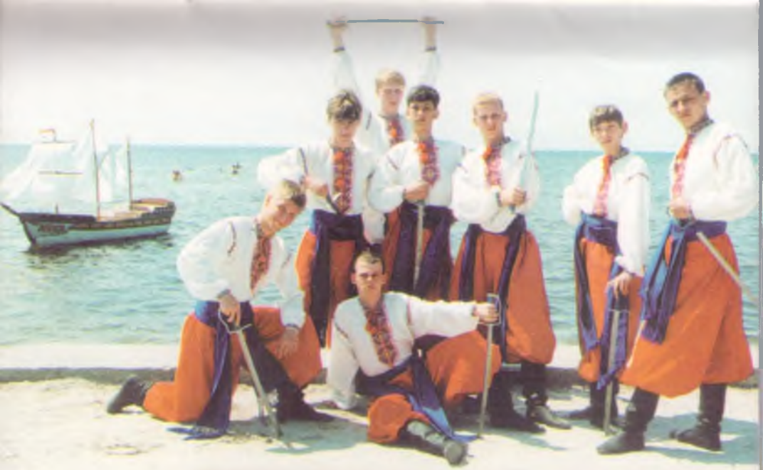
Хореографические коллективы "Металлург" и "Юный металлург"