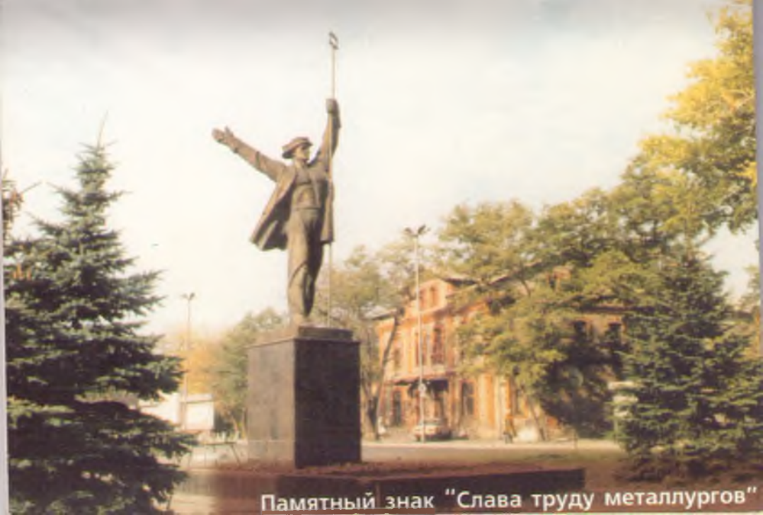
Памятный знак "Слава труду металлургов"