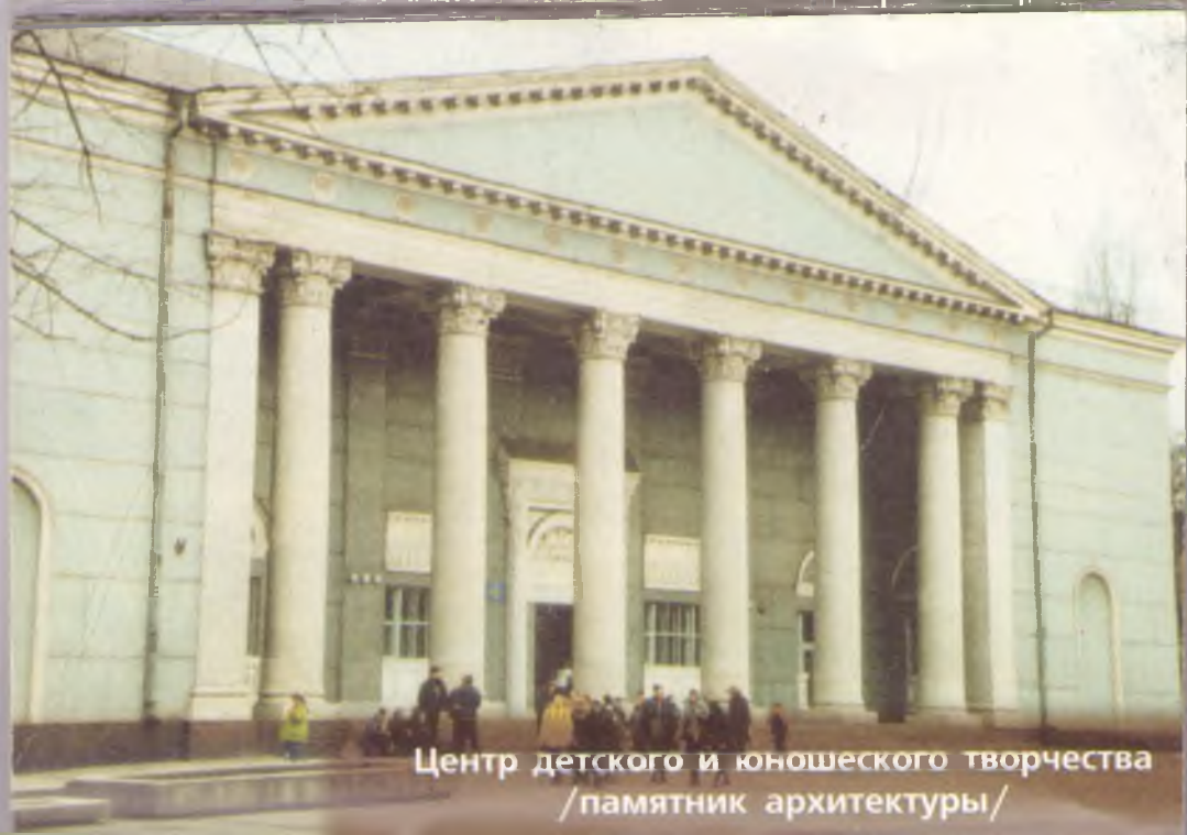
Центр детского и юношеского творчества /памятник архитектуры/