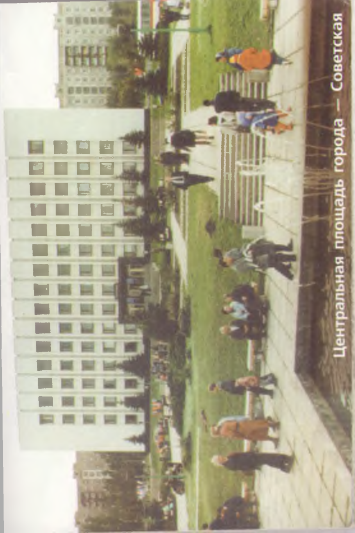
Центральная площадь города — Советская