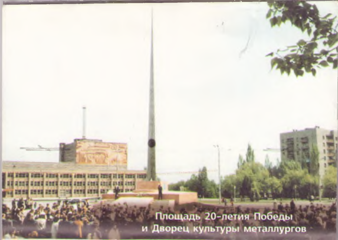
Площадь 20-летия Победы и Дворец культуры металлургов