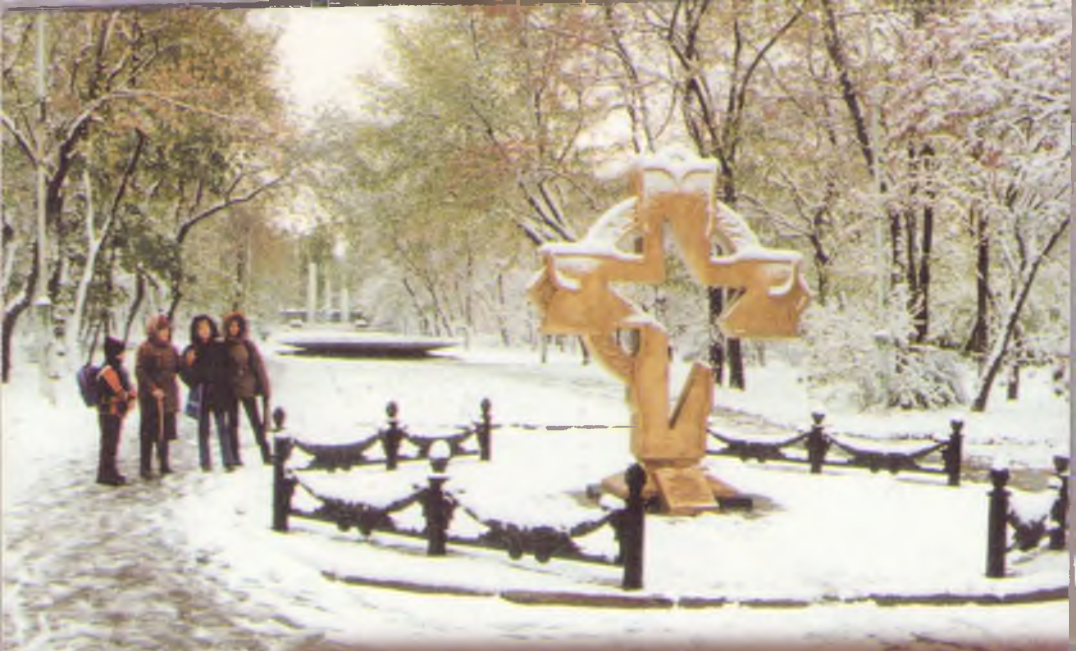
Памятный знак на братской могиле советских воинов в сквере 50-летия комсомола