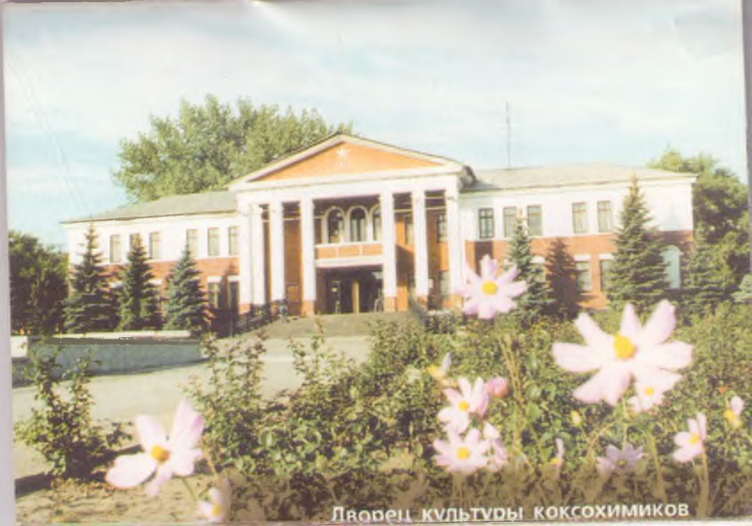
Дворец культуры коксохимиков